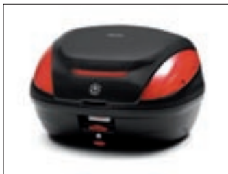
46L spremnik - mat crni