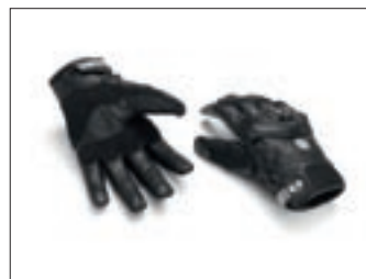
"Urban" ljetne rukavice