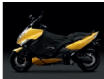
Prekrivač za koljena TMAX