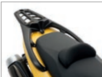
Stražnji nosač TMAX - crni

Kako bi svaku vožnju učinili pravim užitkom, Yamaha je razvila bogat izbor stilizirane i funkcionalne originalne opreme i dijelova. Na taj način svatko može personalizirati svoj skuter. Svaki dio je proizveden sukladno Yamaha standardima - za neupitan komfor i zaštitu. Ovdje možete pronaći dio asortimana za svoj skuter. Neki od ovih proizvoda su dobavljeni u različitim bojama. Za detaljnije informacije, primjenu i dobavljenost, molimo kontaktirajte svog Yamaha trgovca ili posjetite www.yamaha-motor.hr