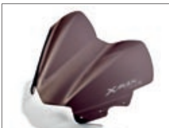
Sportski vjetrobran X-MAX