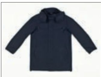
"Commuter" skuter jakna - plava