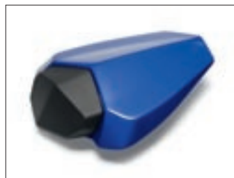
Pokrov sjedala u boji motocikla YZF-R6