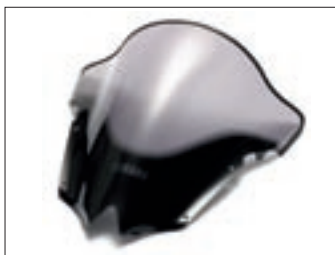
Zatamnjeni "double bubble" vjetrobran YZF-R6