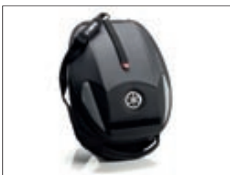
"Sport" tank torba