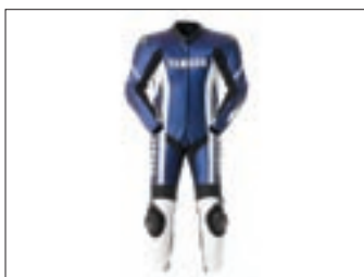
"Speedblock" jednodijelni kombinezon - plavi