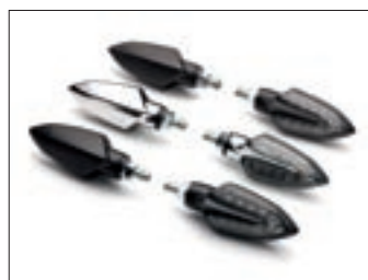
Stilizirani LED pokazivači smjera