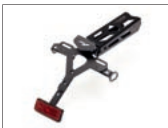
Nosač tablice YZF-R1