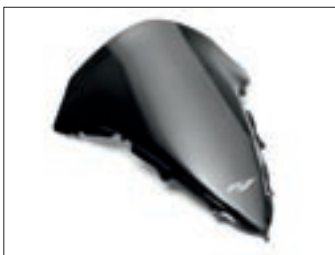
Zatamnjeni "flip-up" vjetrobran YZF-R1

Kako bi svaku vožnju učinili pravim užitkom, Yamaha je razvila bogat izbor stilizirane i funkcionalne originalne opreme i dijelova. Na taj način svatko može personalizirati svoj motocikl. Svaki dio je proizveden sukladno Yamaha standardima - za neupitan komfor i zaštitu. Ovdje možete pronaći dio asortimana za svoj motocikl. Neki od ovih proizvoda su dobavljeni u različitim bojama. Za detaljnije informacije, primjenu i dobavljaljivost, molimo kontaktirajte svog Yamaha trgovca ili posjetite: www.yamaha-motor.hr