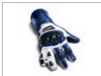
"Speedblock" rukavice - plave